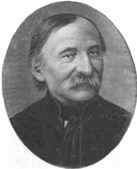
Kriza János Magyar Unitárius püspök