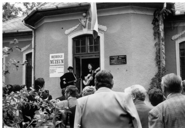
Az UART bölcsőjében két UART-zenész a Beregi Múzeum jubileumi ünnepségén 2005 augusztusában Vásárosnaményban.