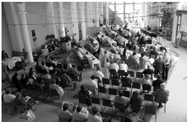
A XXXIII. Tokaji Írótáborban találkoztak a Látó unitárius főszerkesztők

Július 4–6. között tartották a nagyváradi Partiumi Keresztény Egyetemen a II. Partiumi Írótábort. A központi téma: magyar kulturális régiók a Kárpát-medencében.