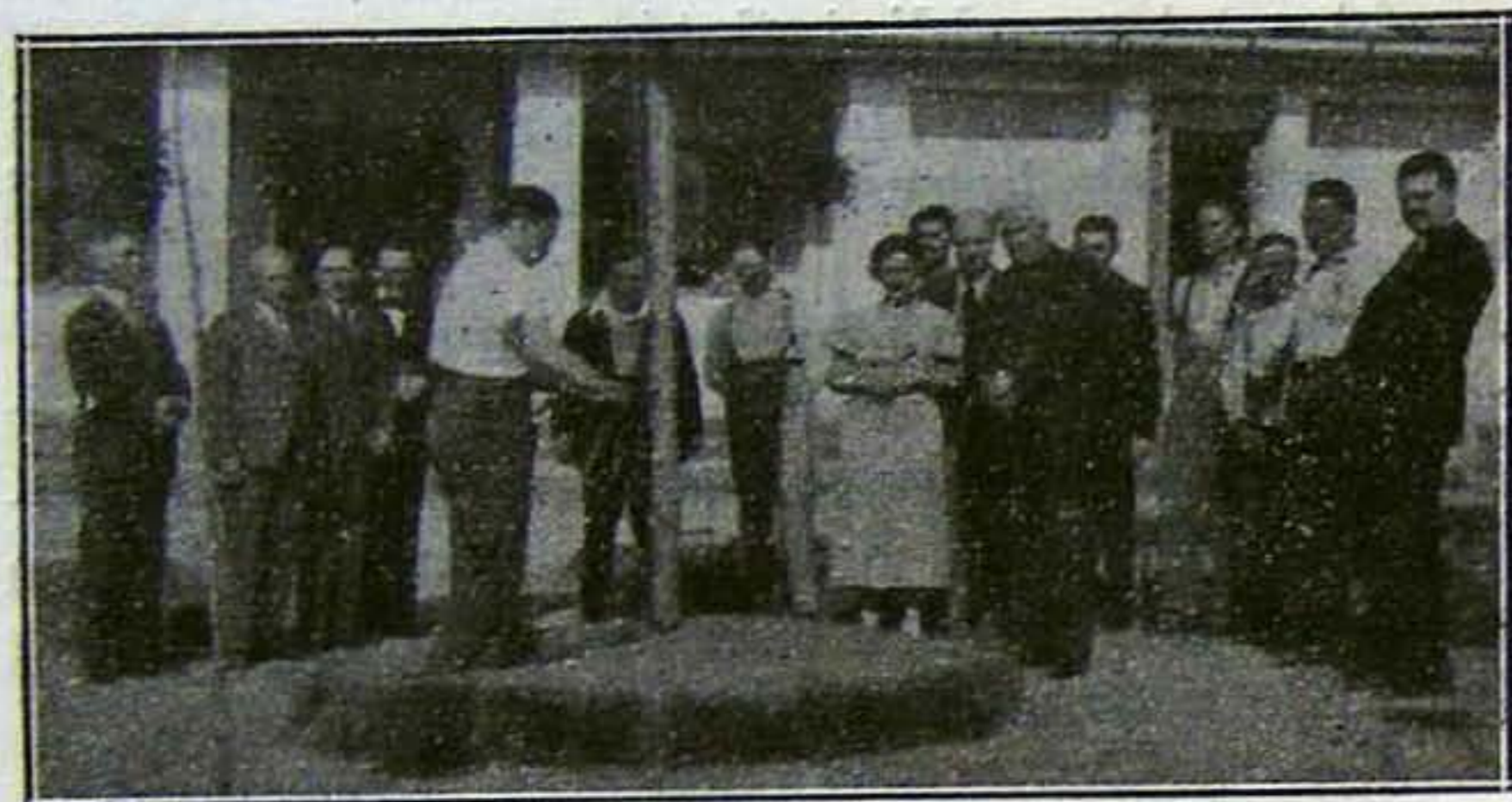
A „Lelki Számadás“ férfi-konferencia megnyitása. Magyarkút, 1937. május 26—27.