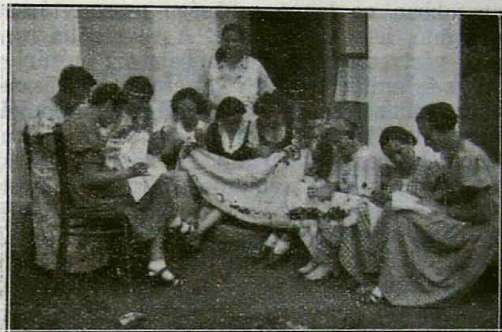
Kézimunka délután a Perczelné Kozma Flóra Unitárius Leányegylet táborozásán. Magyarkut, 1937. július 7—14.

tát sokszor bántóan érintő befolyásnak odaadva az unitárius gyermek, mint ebben a milliós fővárosban. És mégis, hogy mit is jelent, ha a gyermeki lélek mélyén az unitárius öntudat fölparazsló szikráját, azt, annak a kis nyolcesztendő unitárius fiúnak a példája mu-