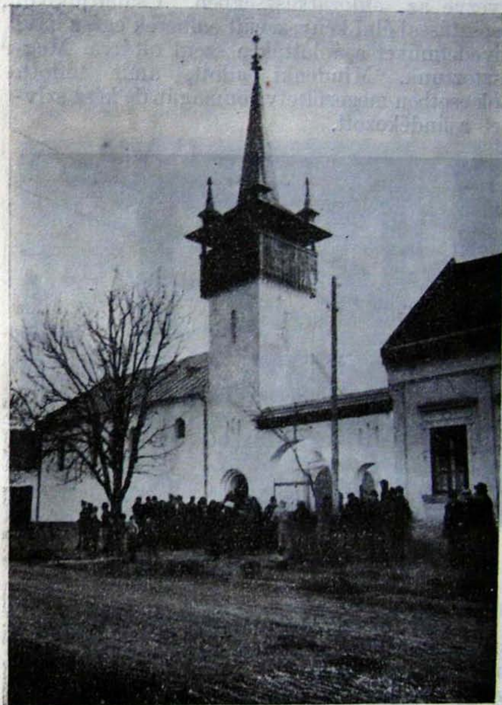
A dunapataji unitárius templom. Felszenteltük 1937. december 5.

Van nagyon szép kis templomunk igazi toronnyal és igazi haranggal. Búbájos erdélyi mesevilág, színben, formában, stílusban. Egy gyönyörű álmot, mindnyájunknak szívünkbe zárt kincse, büszkesége, öröme. Bizonyíték, hogy jól jár az, akit az Ur karjaiba vesz; bizonyíték, hogy nem igaz, hogy hitehagyottak vagyunk, mert ime még közelebb jutottunk Istenhez, aki kegyelmét ennyire bőkezűen szórta reánk. Nem volt nekünk semmink, amikor templomot akartunk építeni, csak a meleg szívünk, a vágyakozó lelkünk és az áldozatos szeretetünk. Ezekkel ujult meg az evangéliumi csoda az öt kenyérrel és a két hallal. Malterünk, téglánk? ... az nem volt, de égett a szívünk lángja és nem volt megoldhatatlan egy templomnak megépítése, mert hittük, hogy lesz és akartuk, hogy legyen. Valahogy egymáros extázisban éltünk; nem tudtunk mi számolni, nem akartunk mi gondolkodni, hiszen akkor talán kétségbe kellett volna esnünk! Ha kérdezték, hogy miből akaruk építeni? ... mi nem tudjuk. Isten annyira segített eddig minden lépésünkben, hogy nem hagy el ezután sem s hogy eddig mindent megadott — és a javukra adott — megadja nekünk a templomot is és megnyitotta a szívek verse-