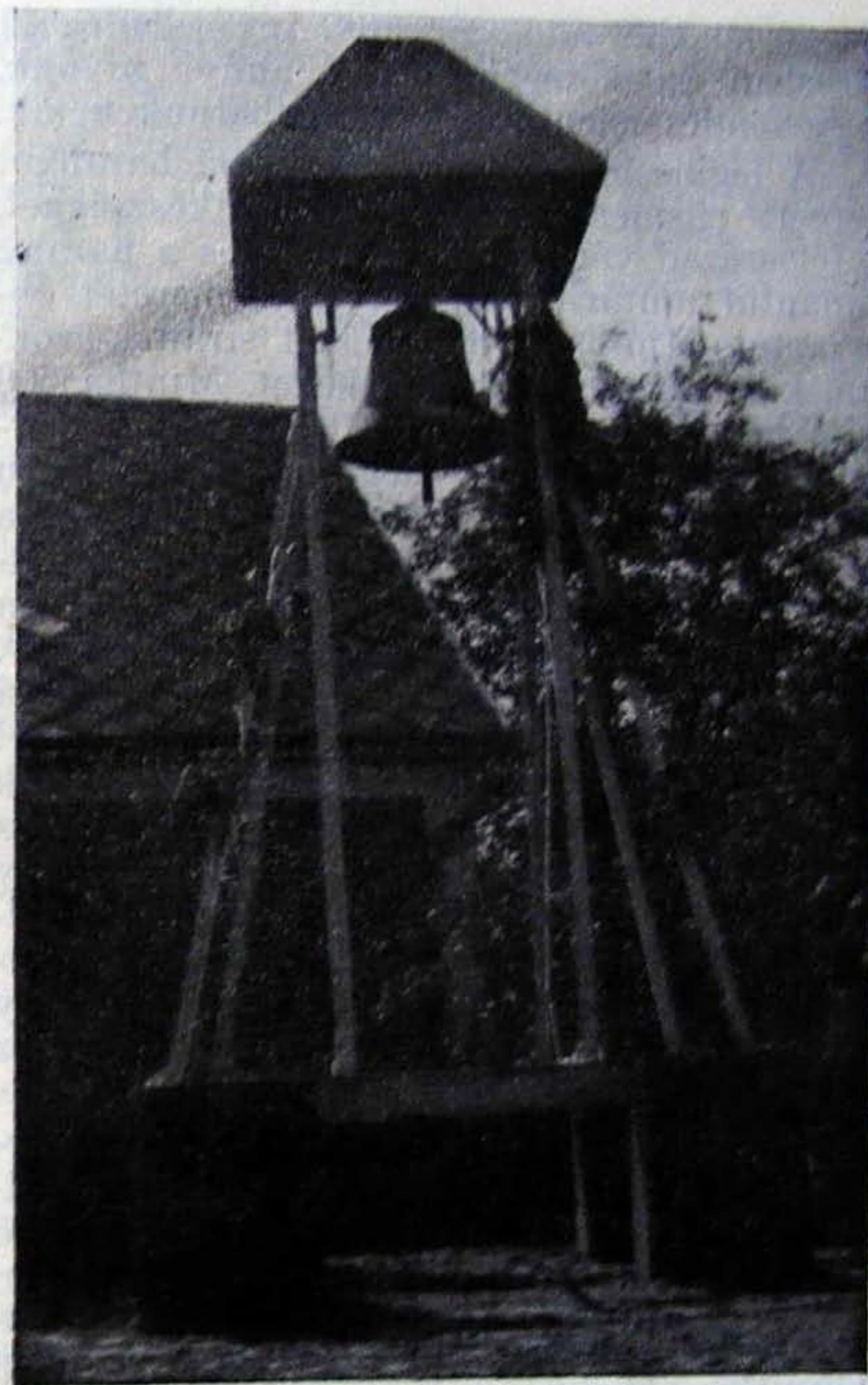
A csajági unitárius harang.

A közelebbi években újra keletkezett Somogy, Veszprém vármegyékben, 4 községben