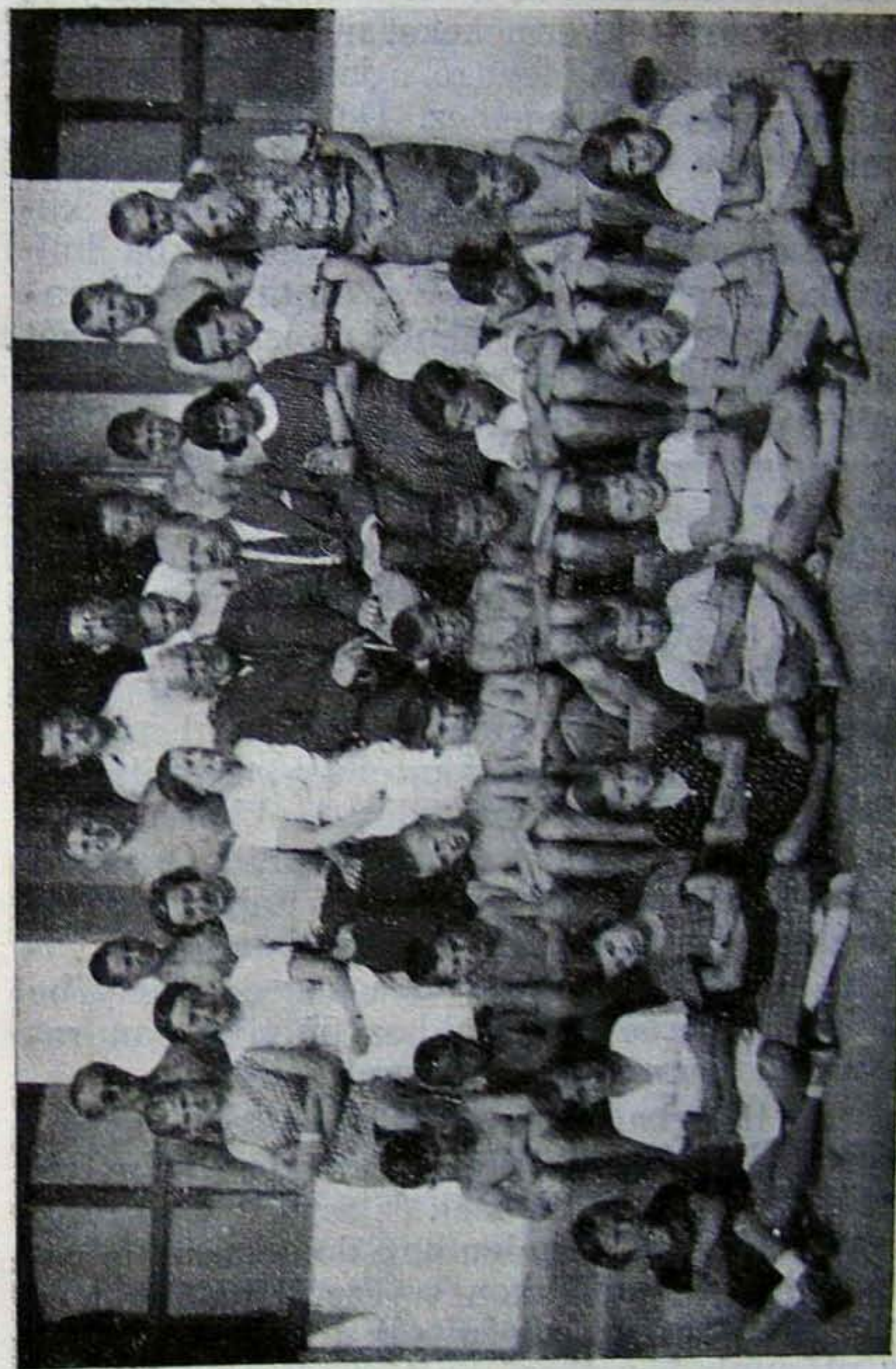
Nyaraló gyermekeink. Magyarokut, 1937. július 4—25.

A gyermekek kiválasztását Nőszövetségünk áldozatos lelkű asszonyai végezték a választó lelkészek ajánlásai lapján. A huszonkilene kis unitárius emberpalánta budapesti, pestkörnyéki és vidéki gyermekekből tevődött össze s azok közül hárman viselték saját maguk nyaraltatási költségeiket, míg a többi ellátásának fedezéséről egyházunk gondoskodott, részben a gr. Batthyányi Ilona alap kamatai terhére, részben pedig adományokból. Elmondhatom a gyermekekkel együtt eltöltött háromhetes nyaralás tapasztalatai alapján, hogy a nyaraltatók kiválasztása sikerült. A gyermekek átlagban egy kilót hiztak, annak dacára, hogy a jó levegőn sokat mozogtak s a levegőváltás az első napokban inkább fogyasztó, mint hizlaló hatással volt rájuk. A gyermekek kiválasztásánál a szociális és unitárius szempontokat egyaránt mérlegeltük. A székesfővárosi gyermekeknél az előbbi, a szórványban lakó gyermekeinknél inkább az utóbbi volt az irányadó mérték. Az unitárius gyermeknyaraltatásnak, mint minden nyári gyer-