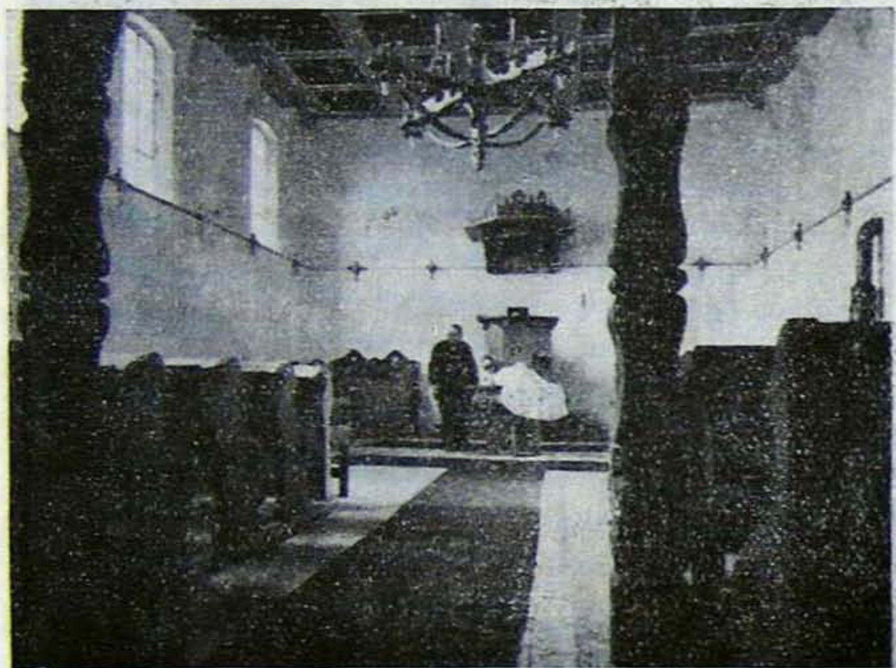
A dunapataji unitárius templom belseje.

nyezve az áldozatkészségben. Családjukban beosztással élni kényszerült emberek egész havi jövedelmüket ajánlották a szent oltárra. Megosztottunk. Mindenki adott, amit tudott. Sok esetben megerőltetve önmagát, de kész szívvel ajándékozott.