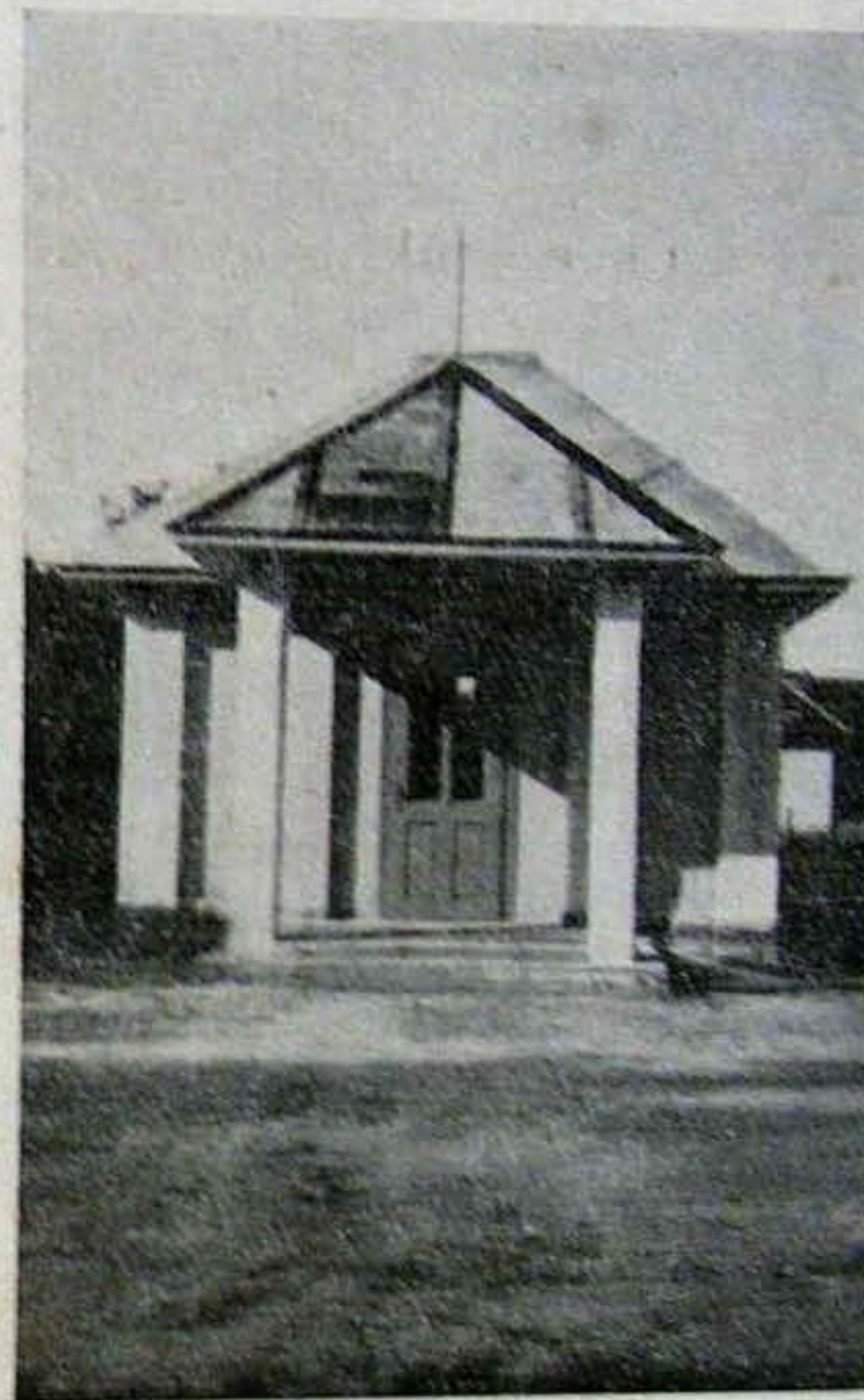
A Perczelné Kozma Flóra Unitárius Leányegylet nyári otthona Magyarokúton.