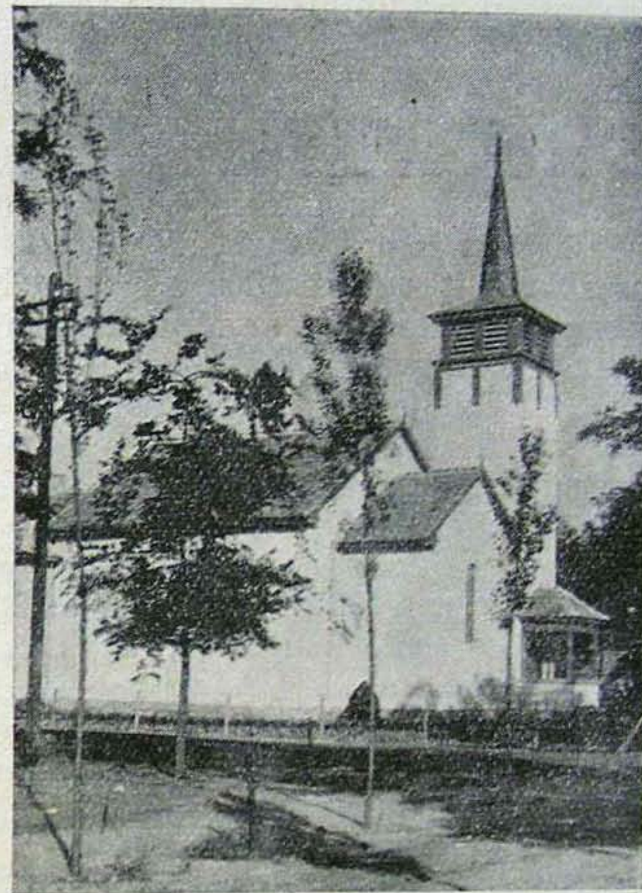
A pestszentlőrinci unitárius templom

lekezet tagjai kell, hogy hozzáadják az építkezéshez. Különben az ők munkájuk kezdődik legkorábban és ér véget legkésőbb. Hosszú esztendőkön